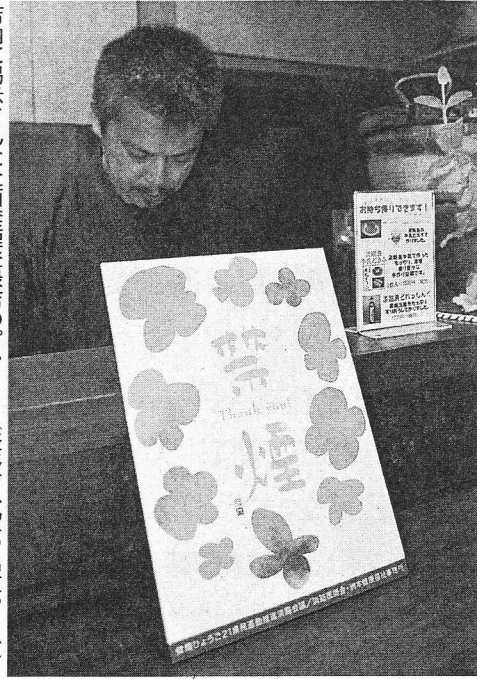
店内に掲示された全面禁煙登録店のプレート(淡路市多賀の「鼓や」で)